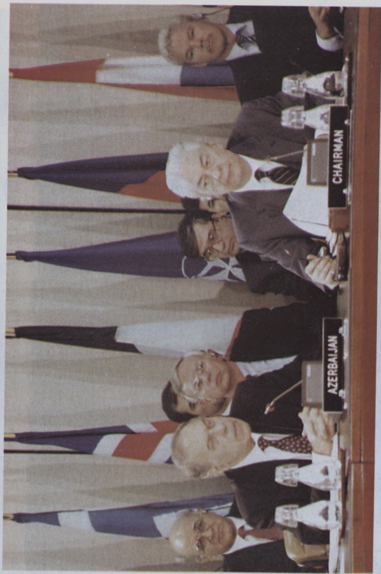
Azərbaycan Prezidenti Heydər Əliyev NATO - nun baş qərargahında