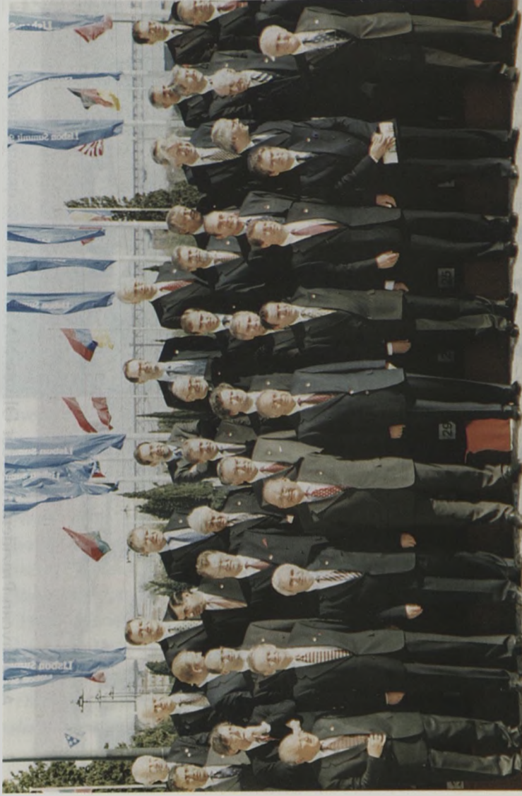
Azərbaycan Prezidenti Heydər Əliyev ATƏT - in Lissabon sammitində