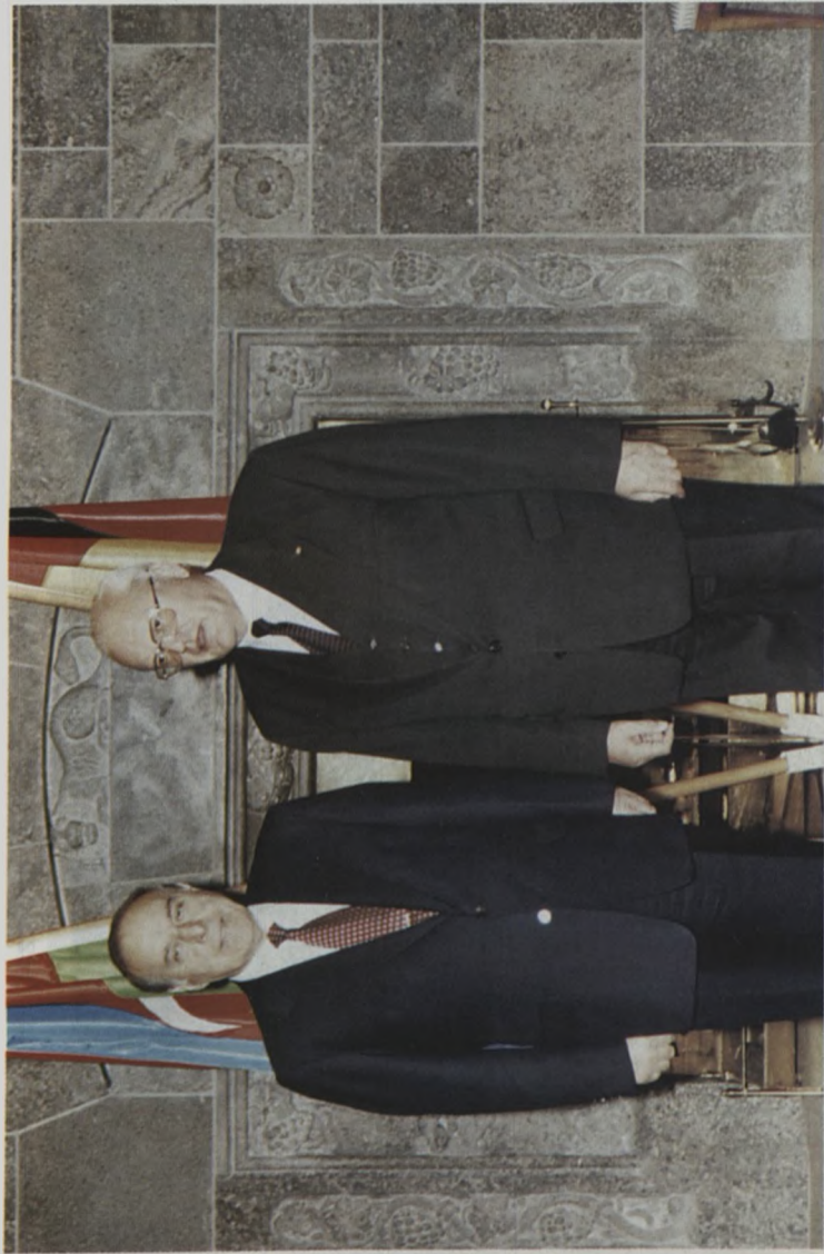
Azərbaycan Prezidenti Heydər Əliyev və AFR Prezidenti Roman Hersoq