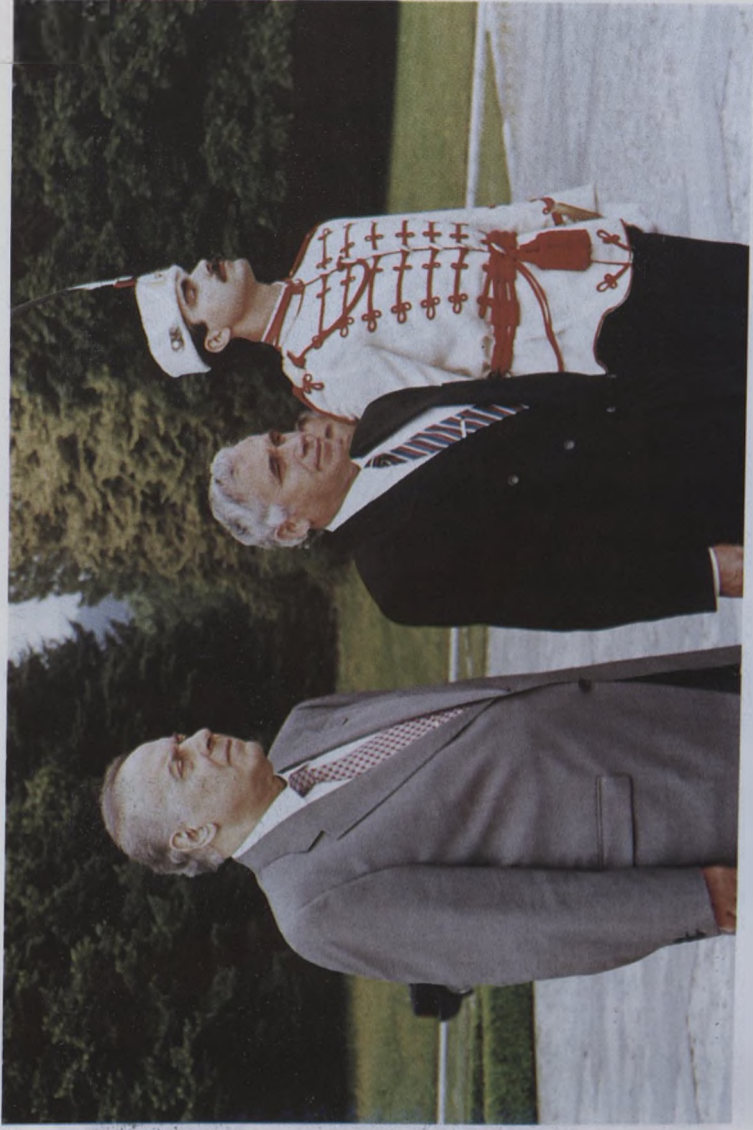
Azərbaycan Prezidenti Heydər Əliyev və Bolqarıstan Prezidenti Jelyu Jelev