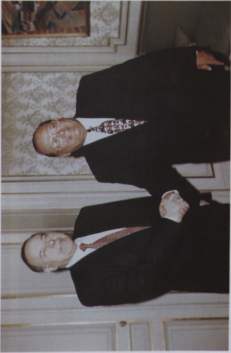
Azərbaycan Prezidenti Heydər Əliyev və Belçikanın baş naziri Jan Luk Dean