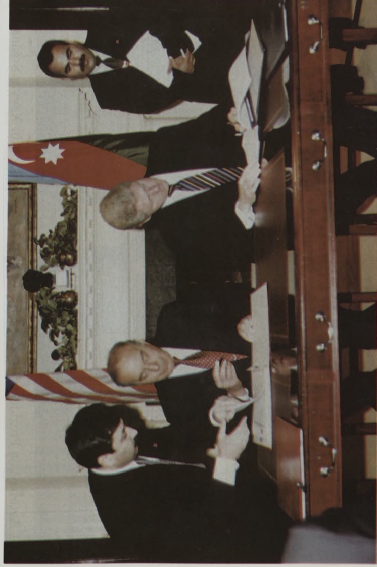
Azərbaycan Prezidenti Heydər Əliyev və ABŞ Prezidenti Bill Klinton