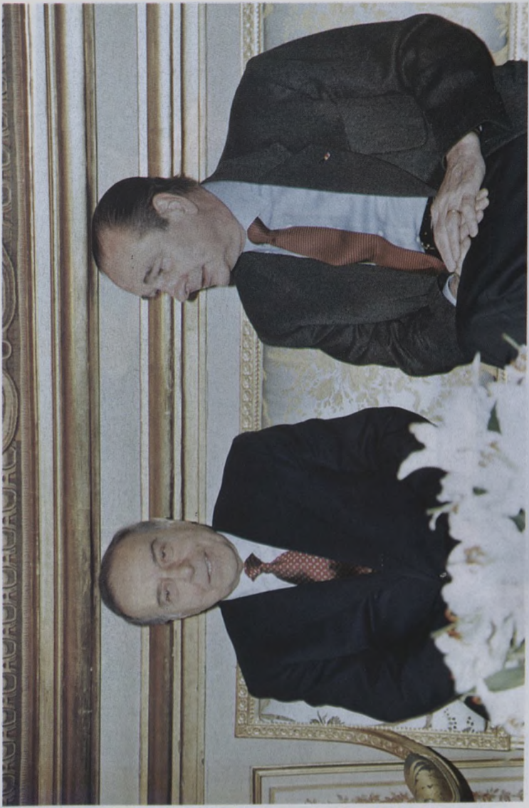
Azərbaycan Prezidenti Heydər Əliyev və Fransa Prezidenti Jak Şirak