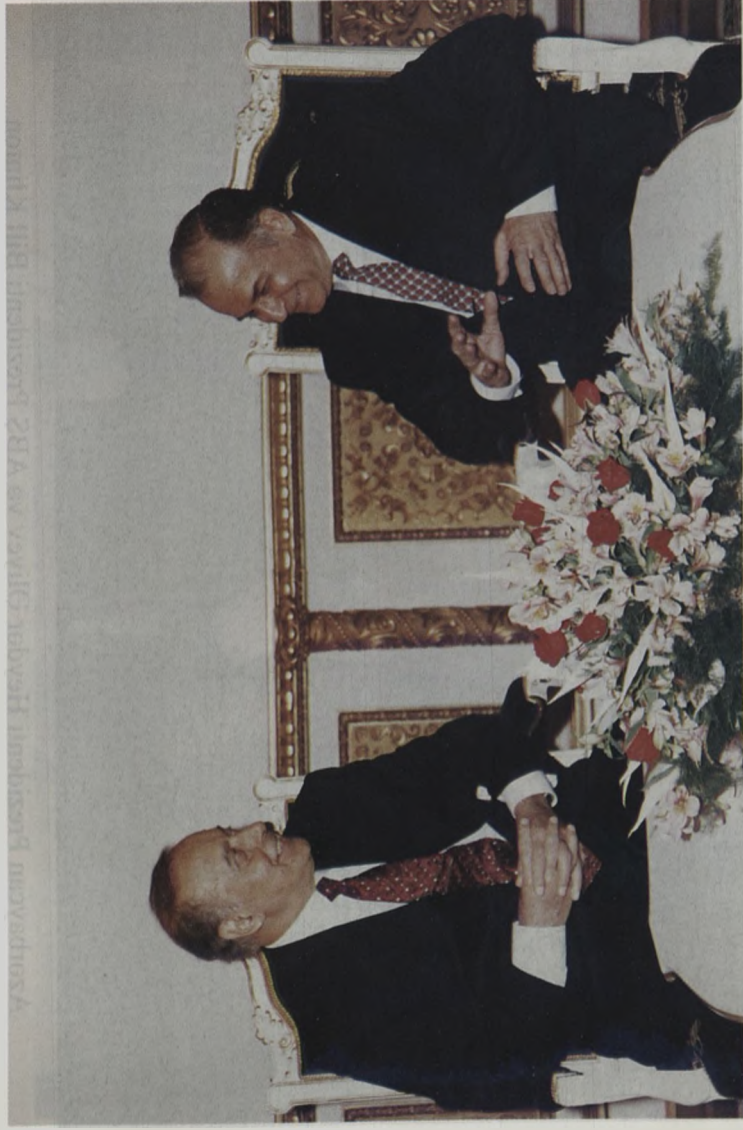
Azərbaycan Prezidenti Heydər Əliyev və Rumıniya Prezidenti İon İliyesku