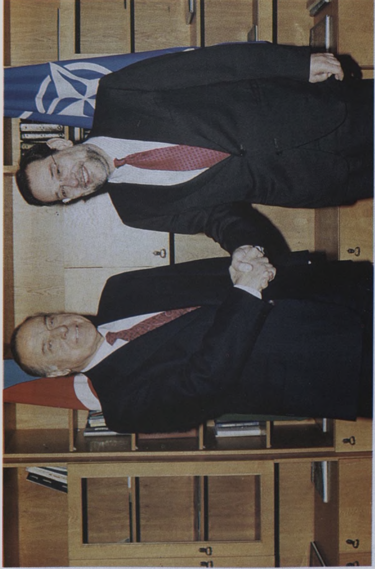
Azərbaycan Prezidenti Heydər Əliyev NATO - nun baş katibi Xavyer Solana