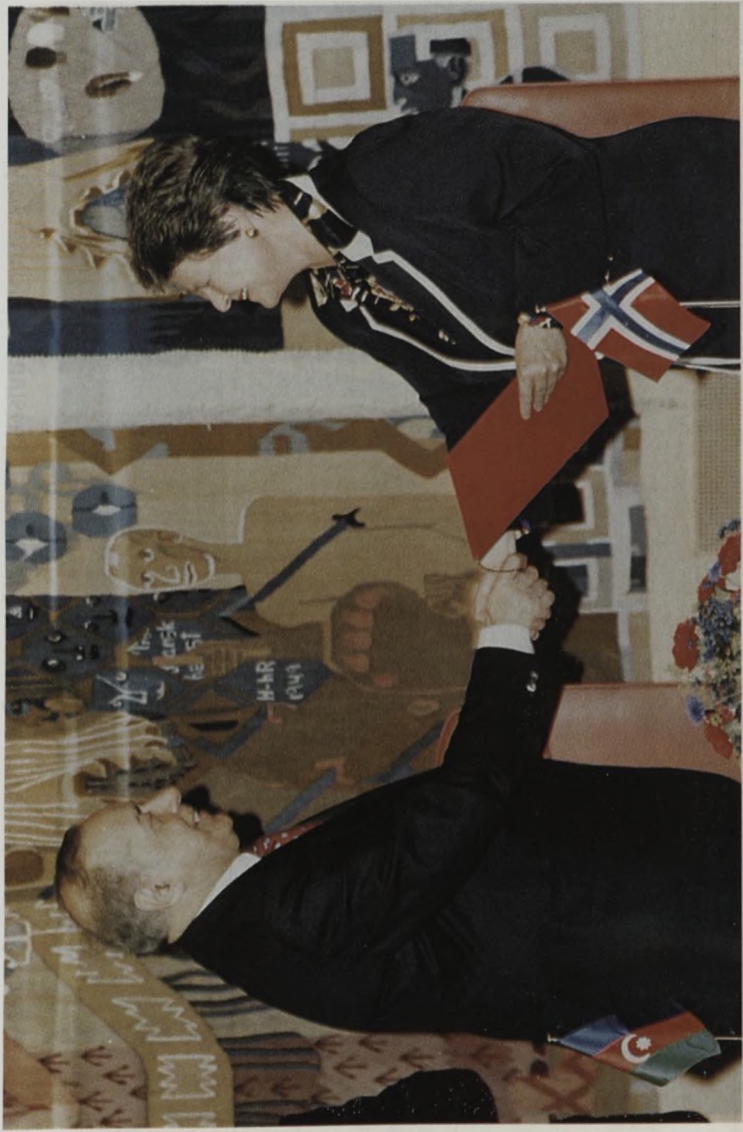
Azərbaycan Prezidenti Heydər Əliyev və Norveçin baş naziri Qru Harlem Brundtland