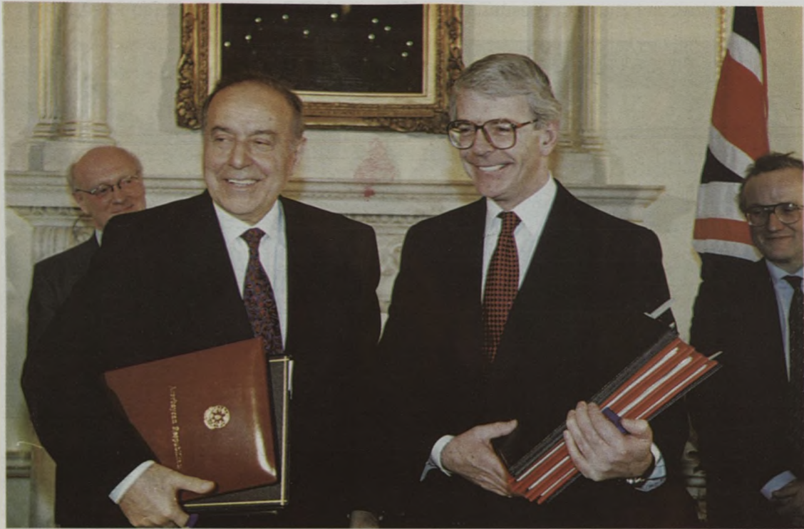
Azərbaycan Prezidenti Heydər Əliyev və Böyük Britaniyanın baş naziri Con Meycor