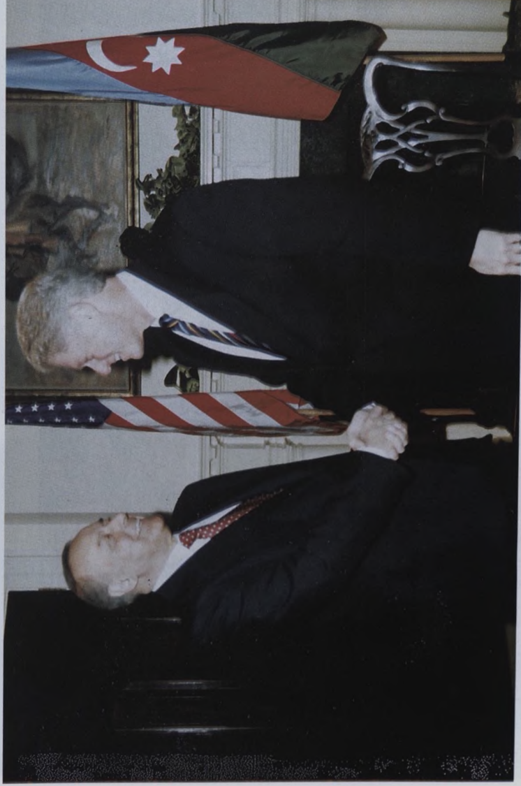
Azərbaycan Prezidenti Heydər Əliyev və ABŞ Prezidenti Bill Klinton