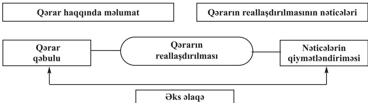
Şəkil 1. Problemin həll prosesinin pillələri

Qərar hər hansı problemin həlli məqsədilə qəbul edilir. Problemin həll prosesi üç pillədən ibarət olur (şəkil 1).