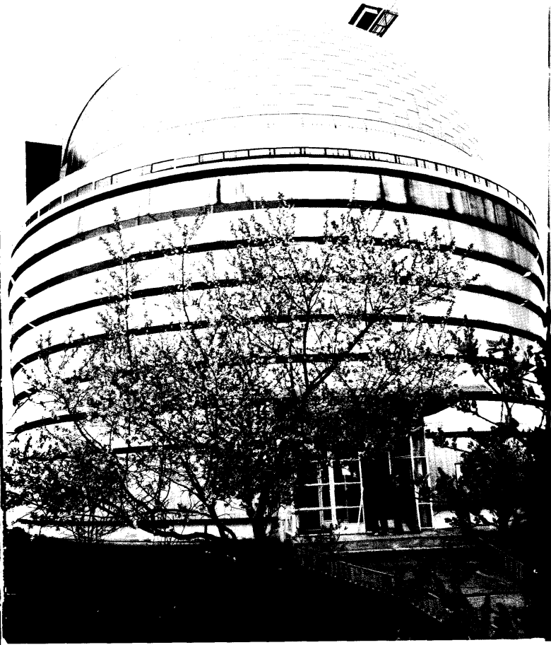
N.Tusi adına astrofizik rəssədxana. Şamaxı, Pirqulu.

Obyektlərə baxış ekskursiya metodunun əsas hissəsi sayılır və bu prosesi ekskursiya rəhbəri həyata keçirir. Bu proses metodiki işləməyə uyğun olaraq müəyyən bir planla aparılır. Obyektlərə baxış ekskursiya rəhbərinin danışıqları ilə müşayiət olunur və bu zaman onlara yaxşı hazırlanmış təhlil verilir, lazımı izahlar edilir.